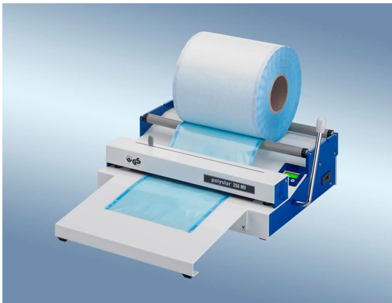
polystar® 250 MV 带切割装置，可拆卸的工作台和膜卷架